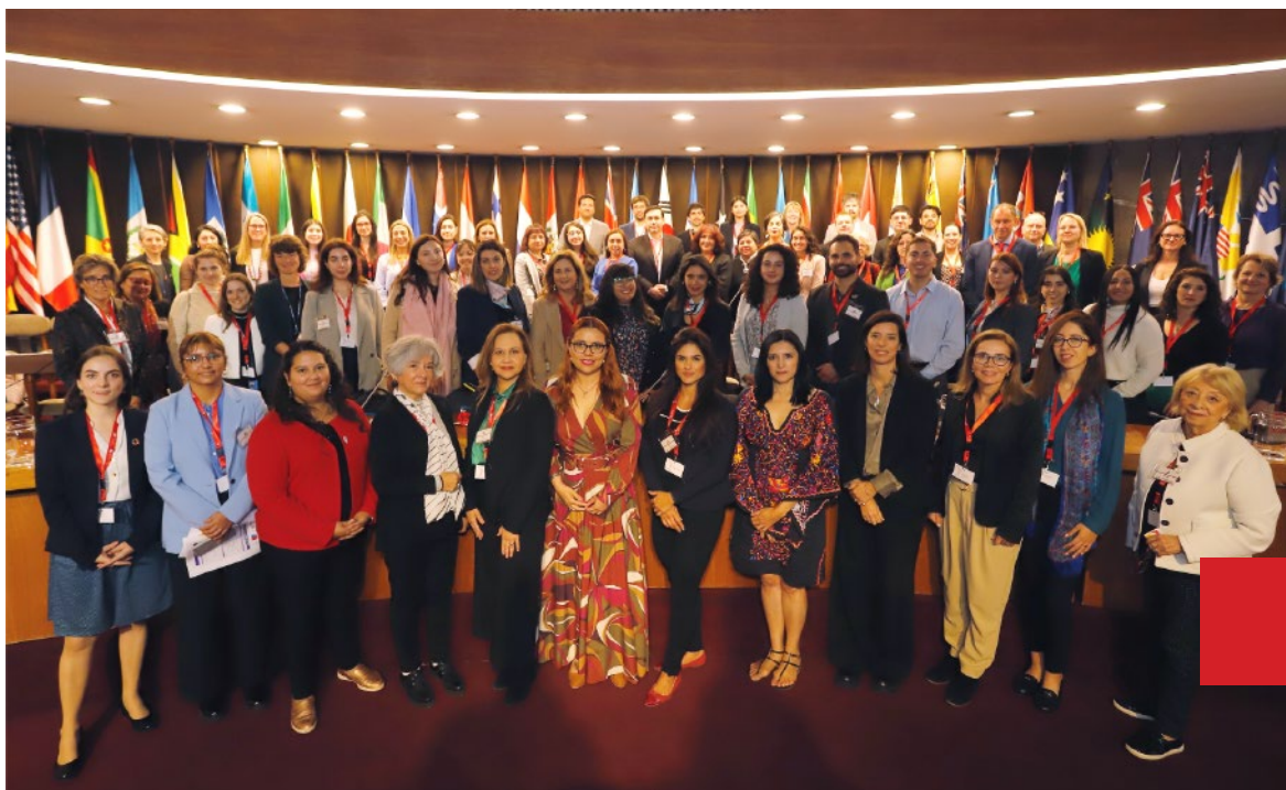
Foto grupal de I@s participantes de toda la región en la Sala Raúl Prebisch de la CEPAL.

El 10 de mayo se realizó en Santiago de Chile la mayor Conferencia Latinoamericana CEGEN LAC 2023 (Capacidades de Cambio y el Empoderamiento de Género en Energía), sobre equidad de género, reuniendo a autoridades y líderes de toda la región.