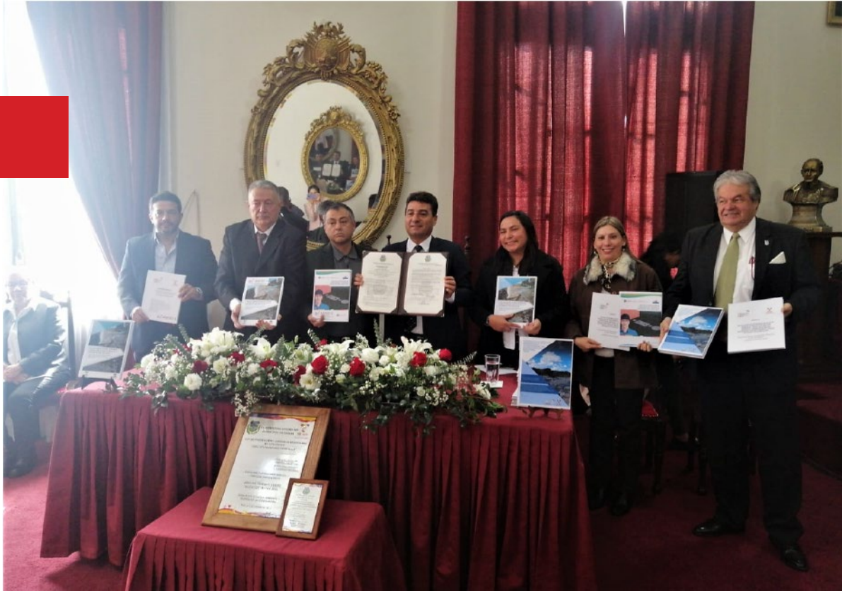
Promulgación de la Ley Municipal de Tarija No. 335 de Protección y Conservación del Río Guadalquivir “José Eduardo Farfán Mealla”. Tarija, 2023.

En este contexto, los cauces y riberas se convierten en un objeto que se debe proteger y conservar. En apoyo al Gobierno Autónomo Departamental de Tarija y a los gobiernos municipales de Tarija y San Lorenzo, GIZ/PERIAGUA contribuyó a la delimitación de 24 kilómetros para establecer las zonas hídricas, y las de protección ambiental y uso público, como bienes municipales.