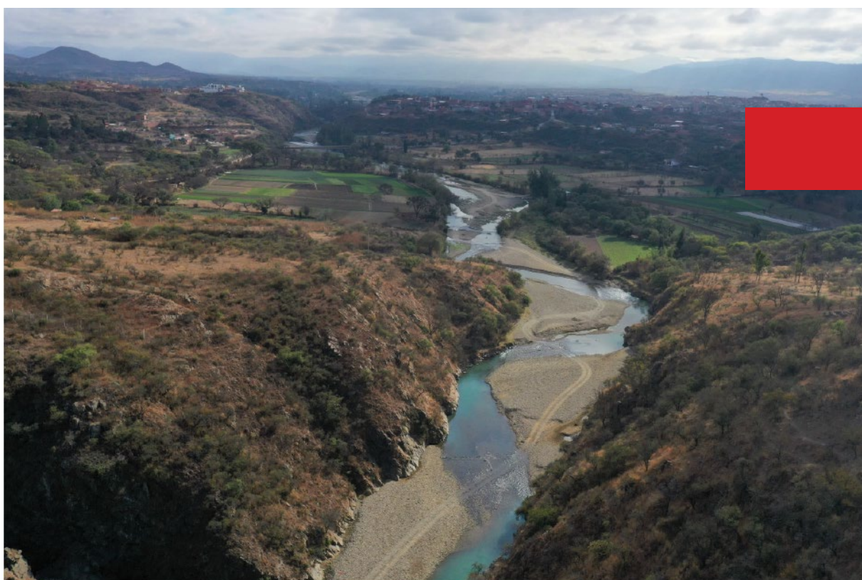
Cauce del Río Guadalquivir. Zona de Obrajes – Aranjuez, Tarija, 2022.

El acelerado crecimiento poblacional en Tarija implica además un mayor riesgo de contaminación de las fuentes de agua, afectación a los suelos y la consecuente degradación de ecosistemas. El Río Guadalquivir es una de las principales fuentes de abastecimiento de agua para las*os tarijeñas*os, pero sus cauces y riberas han sido impactados por prácticas humanas, como las construcciones de viviendas y avallasamientos, entre otras.