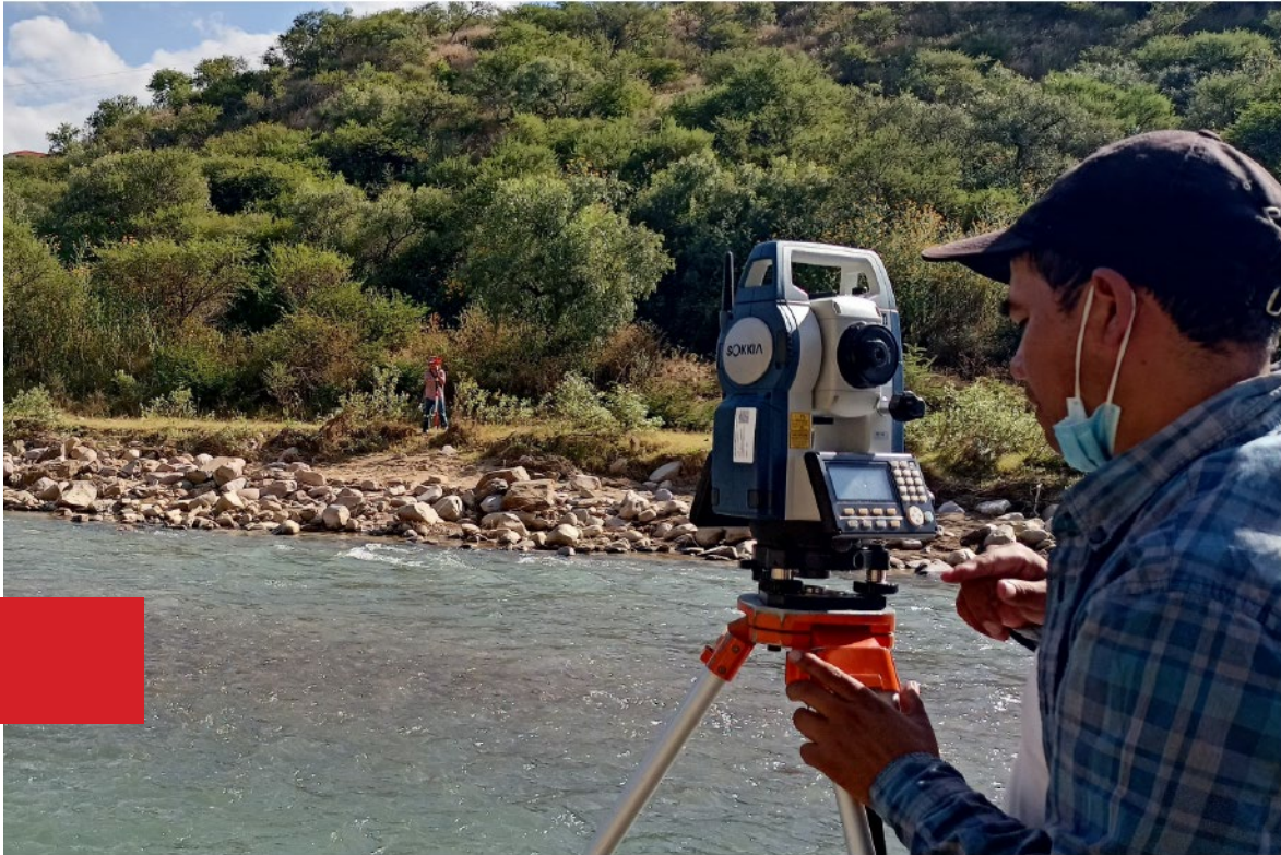
Levantamiento topográfico / hidráulico de un tramo del Río Guadalquivir, delimitación de franjas de protección. Tarija, 2022.